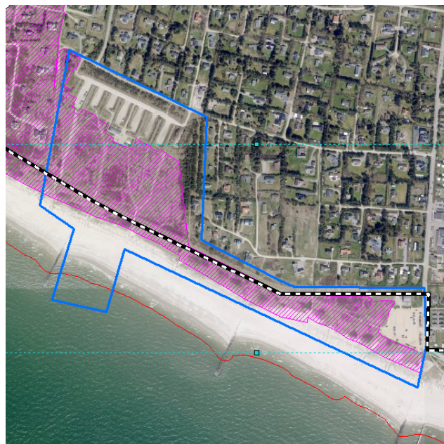
Figur 1 Projektområdet med §3 beskyttede områder og Oksbydige markeret